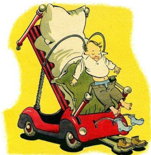
Иллюстрация К. Ротова к стихотворению А. Митты «Чудо-кровать»

Сидеть да лежать, болезни поджидать (рус. нар. поговорка).