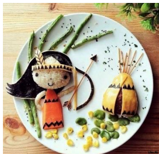
Фотограф Саманта Ли создает картины из обычной еды.

Как жуёшь, так и живёшь (рус. нар. поговорка).